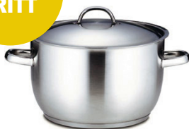
Hackman Classic 10 l www.torebrings.se 526,50 kr