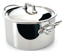
Mauviel M'Cook 6 l www.bagarenochkocken.se 3 559 kr