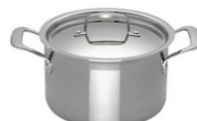
Le Creuset 3-PLY 4 l www.verner-verner.se 1 339,00 kr